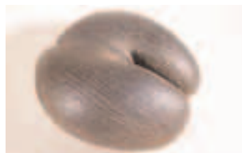
Cocofesse-Coll. Muséum d'histoire naturelle de Grenoble

Présentation du mardi 4 mai au mardi 1 juin Rencontre le mercredi 26 mai de 16h à 17h.